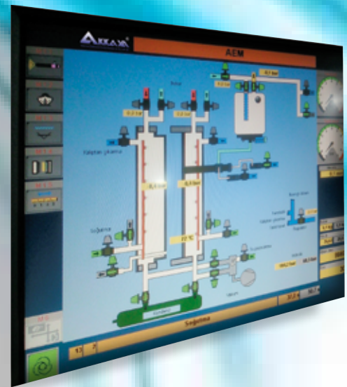
Сенсорная Панель Управления